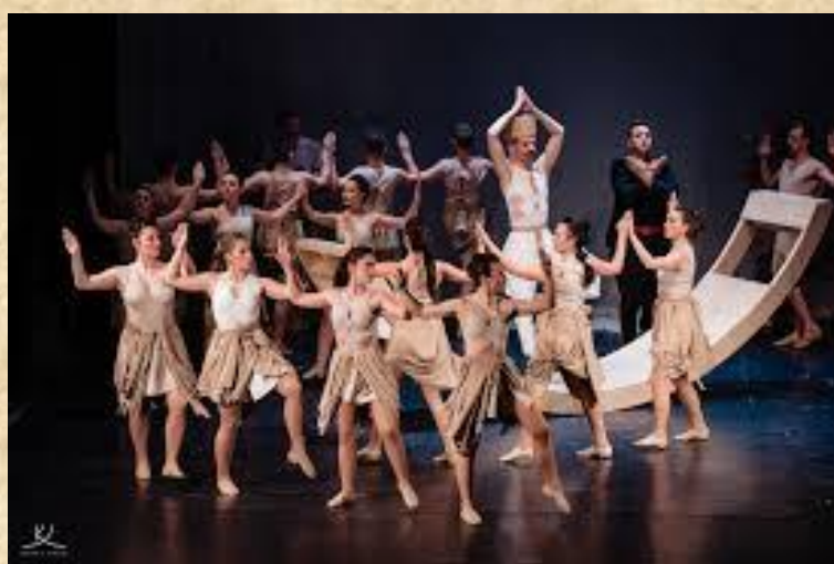
Jelent az előadásból